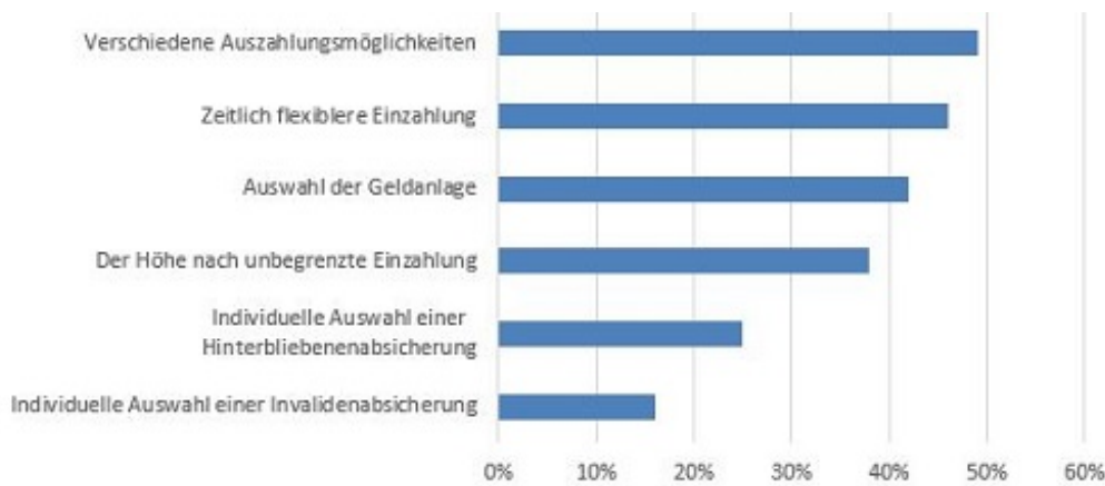
Abbildung 3: Angenommen, Sie könnten sich eine betriebliche Altersvorsorge nach Ihrem eigenen Wunsch gestalten. Welche der folgenden Merkmale wären Ihnen besonders wichtig?

Auch für die Kommunikation gibt es nicht den Königsweg, der allen Mitarbeitern gleichermaßen gerecht wird. Das Vorwissen und das Verständnis für bAV sind – unabhängig vom Bildungsgrad – sehr unterschiedlich ausgeprägt. Davon abgesehen, gibt es noch zu viele Fälle, in denen gar keine oder unzureichende Informationen für Arbeitnehmer verfügbar sind. 58 Prozent der Befragten fühlen sich nicht ausreichend informiert. Und nur 43 Prozent haben uneingeschränktes Vertrauen in die Informationen, die sie erhalten. Anders herum fühlen sich nur 30 Prozent ausreichend – und das heißt noch nicht gut – informiert und haben gleichzeitig Vertrauen in die Informationen. Angesichts dieser Umstände verwundert es nicht, dass die bAV noch viel Entwicklungspotential hat.