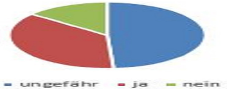
Abbildung 1: Haben Sie eine Vorstellung von der Leistung, die Sie bei Ihrer Pensionierung aus der gesetzlichen Rentenversicherung erhalten werden?