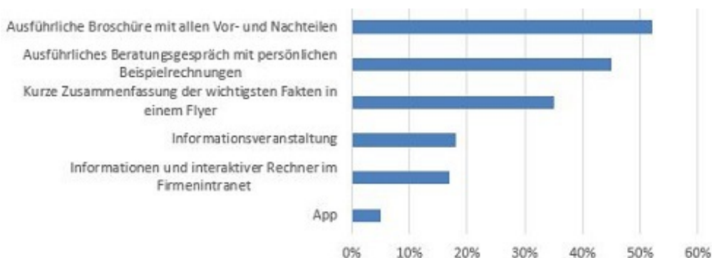
Abbildung 4: Wie möchten Sie am liebsten zur bAV informiert werden? (Mehrfachnennungen möglich)

Neben der Frage, ob überhaupt informiert wird, ist zu klären, wie am besten informiert wird. Zwar wünschen sich die Arbeitnehmer mehrheitlich eine detaillierte Information, beispielsweise über eine entsprechende Broschüre. Aber diese Mehrheit beträgt – trotz der Möglichkeit der Mehrfachnennung – nur 52 Prozent (Abbildung 4). Um also möglichst viele Arbeitnehmer zu erreichen, bedarf es unterschiedlicher Kommunikationsangebote und -mittel.