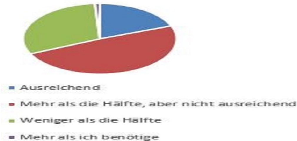
Abbildung 2: Wie hoch schätzen Sie den Anteil der gesetzlichen Rente an Ihrem tatsächlichen Bedarf als Rentner ein?

Die Notwendigkeit einer zusätzlichen Absicherung des Alterseinkommens ist den Arbeitnehmern somit klar. Die Arbeitnehmer ergreifen auch zahlreiche Sparmaßnahmen, nur 18 Prozent geben an, sie würden nicht vorsorgen. Allerdings spielt die bAV bei diesen Sparmaßnahmen eine untergeordnete Rolle. Während Sparbuch/Festgeldkonten zu Sparzwecken trotz kaum vorhandener Zinsen mit 41 Prozent am weitesten verbreitet sind, betreiben nur 22 Prozent der Befragten Entgeltumwandlung im Rahmen der bAV.